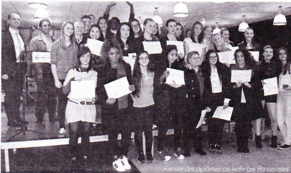
Remise des diplômes au lycée Les Pannevelles