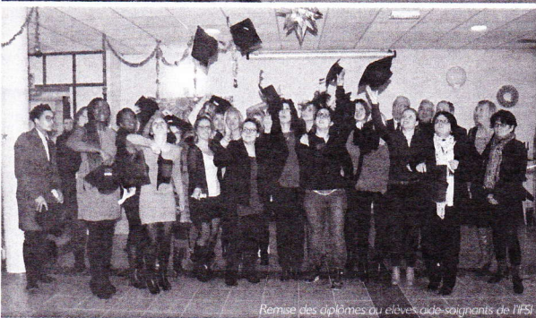
Remise des diplômes aux élèves aides-soignants de l'IFI