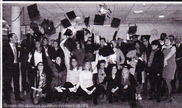
Remise des diplômes aux élèves infirmiers de l'IFI