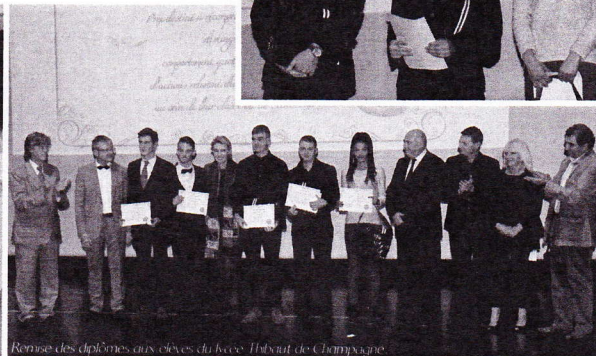
Remise des diplômes aux élèves du lycée Thibaut de Champagne